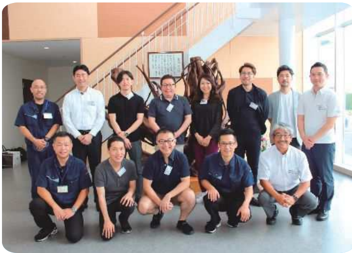
玄関ホールにて記念撮影。

九月十日、麗澤大学の教授他七名とモラロジー道徳教育財団の部長と大垣共立銀行（以下 大共）池田支店の支店長、支店長代理の総勢十名の方が、弊社へトイレ掃除の研修に来社されました。始めに、教授より弊社の道徳と経営についてや松岡相談役から清水社長への社風の継承などについて質問が出され、清水社長が答えられました。その後、四つのグループに分かれて、トイレ掃除の実習を一時間行いました。そして、教授、教授、教授、モラロジーの部長、大共の支店長、支店長代理が工場見学をされました。最後に質疑応答が行われました。